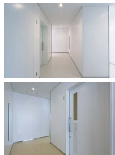
上:1階トイレ2入り口 下:2階トイレ6入り口