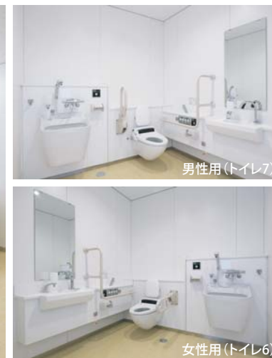
2階にはオストメイトの方に配慮した多目的トイレを男女別に設置。