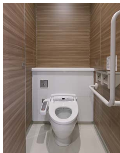
洗浄水量6L、超節水タイプの大便器を採用し、経済性と環境配慮を両立。