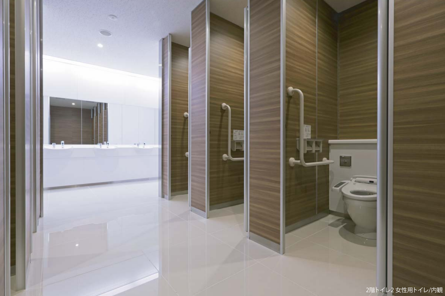
2階トイレ2 女性用トイレ/内観