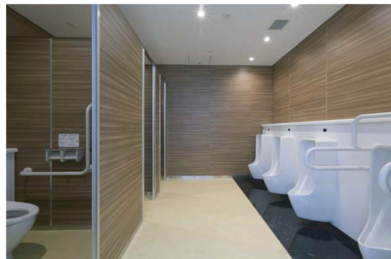
子どもにも使いやすい低リップタイプ、かつ節水効果の高い小便器を採用。また男女トイレとも全ての個室に、男子トイレ内小便器の各1ヶ所に手すりも設置された。