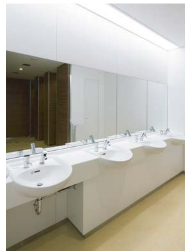
手洗いには非接触の機器を採用し、利用者には清潔感と快適性を提供。