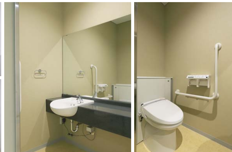
落ち着いた色調でまとめられたVIP専用トイレ。完全個室になっており、リラックスして利用することができる空間になっている。