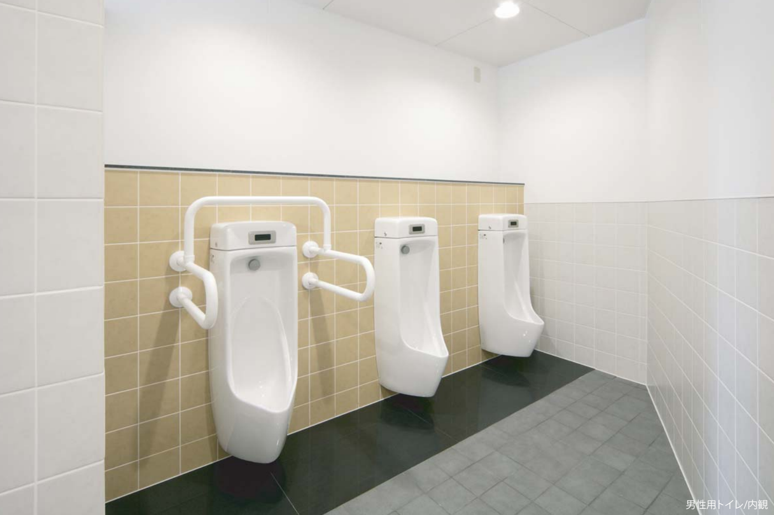
男性用トイレ/内観