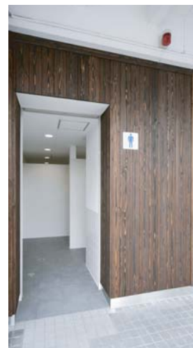
男性用トイレ入り口