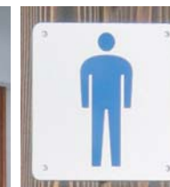
男性用トイレサイン