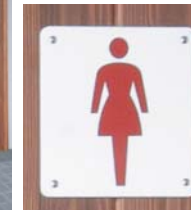
女性用トイレサイン