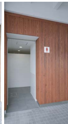
女性用トイレ入り口