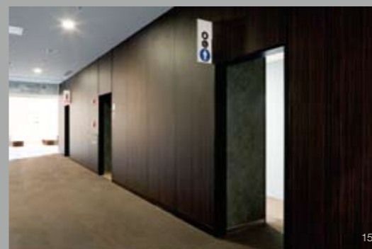
15——多摩総合医療センター:1階トイレ入り口 | 16——同多目的トイレ | 17——同女子トイレ

なかた・やすまさ——多摩医療PFI株式会社施設整備部長 / 1989年、清水建設設計本部入社。1999年、同医療福祉本部。2006年、多摩医療PFI株式会社に出向。