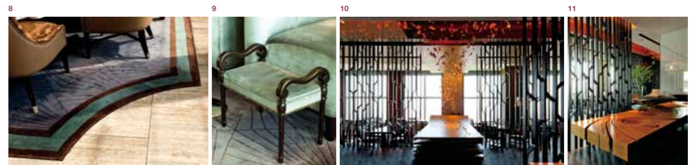
7 — イタリア料理ピチャチュレ: イタリアを象徴するオリーブグリーンやブラウンを基調とし、艶やかにまとめられている。シャングリアはベネチア製 8 — 大理石に絨毯を象嵌したレストランの床: デザイナーが特にこだわってデザインしたという 9 — さりげなく置かれたイスとセットのサイドチェア 10 — 日本料理など: インターナショナルな視点で解釈した“日本の森”が表現されている。黒を基調にした和モダンな空間 11 — 水面に滴(しずく)が落ちたイメージのアートワーク