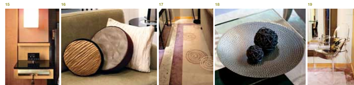
14——ガーデンスイートのリビング:江戸時代から伝わる金、黄、紅色とさまざまな種類の茶色でまとめられた和みの空間。「エグゼクティブハウス 禅」の客室は一つひとつ趣が異なるが、一貫して「侘び・寂び」をテーマにモダンにデザインされている