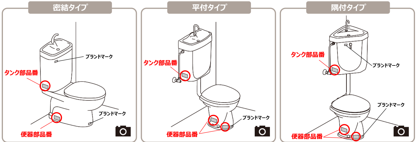
タンク品番表示例

洋風便器の部品特定には便器部とタンク部両方の品番が必要です。 便器部・タンク部ともに左側面の品番シールの撮影をお願いします。